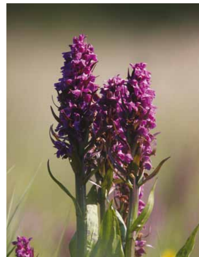
Majgøgeurten vokser tæt i Gulstav Mose.

- På en måde er det de senere årtier blevet mere nødvendigt med græssende dyr i mange danske naturområder. Industrielandbruget og den meget intensive produktion af husdyr fører nemlig på mange egne til nedbør beriget med næring, der stammer fra fordampningen fra stalde-