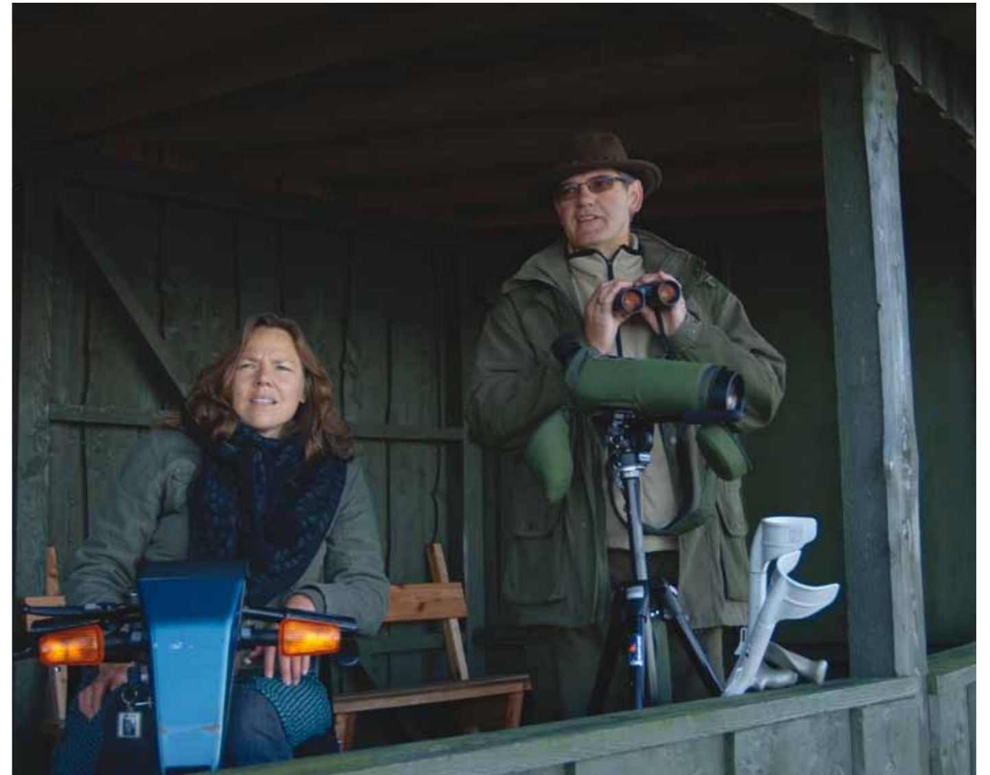
Fra fugleskjulet ved Bøjden Nor kan også kørestolsbrugere nyde synet af de mange fugle.