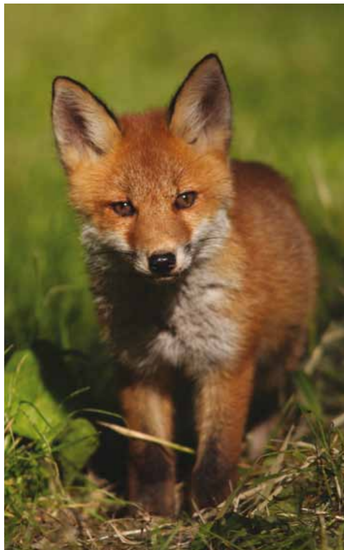
Sød ser den ud ræveungen, men et problembarn på strandengen.

- Jeg vil tro, at vi allerede i løbet af foråret 2010 kan fornemme, om rovdyrspærringen har været en gevinst for fuglene på Nyord. Rævebestanden er stor på Ulvshale-halvøen, hvor der ligger et større sommerhusområde. Det er herfra, at rovdryrene sniger sig over broen til engfuglenes land, siger biologen i Fugleværnsfonden.