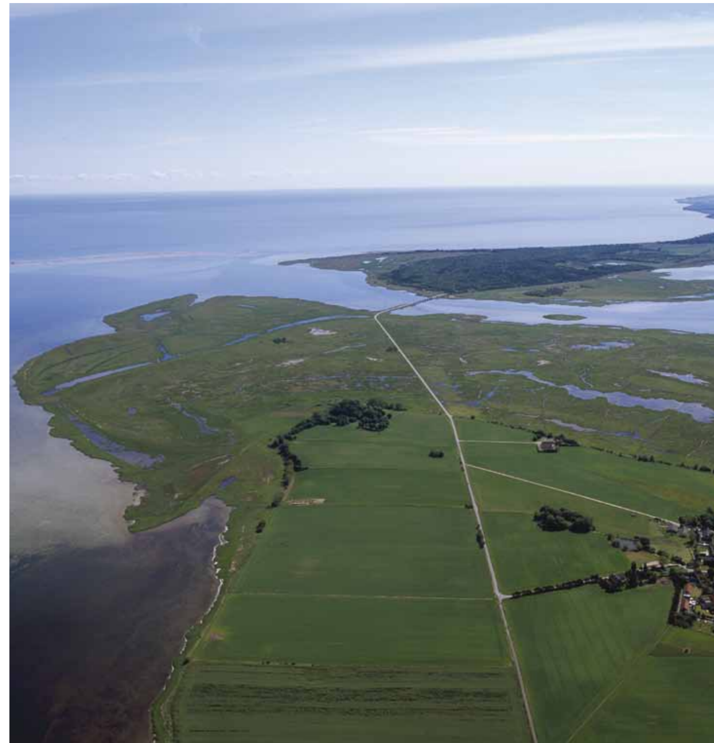
Nyord Enge set fra oven.

- Vi får mere og mere fokus på nødvendigheden af at indgå partnerskaber for eksempel med andre fonde eller virksomheder. Det vil sige, at vi laver en aftale med ejeren af et naturområde om at gennemføre en fugle- og naturvenlig drift af arealet. Med aftalen i hånden går vi så at sige ud og spiller en aktiv rolle som fugle- og naturforvaltere ved at lave en nøje gennemtænkt naturpleje og udføre naturgenopretninger, som gør det pågældende område bedre for fugle, fauna og flora. På den måde behøver vi