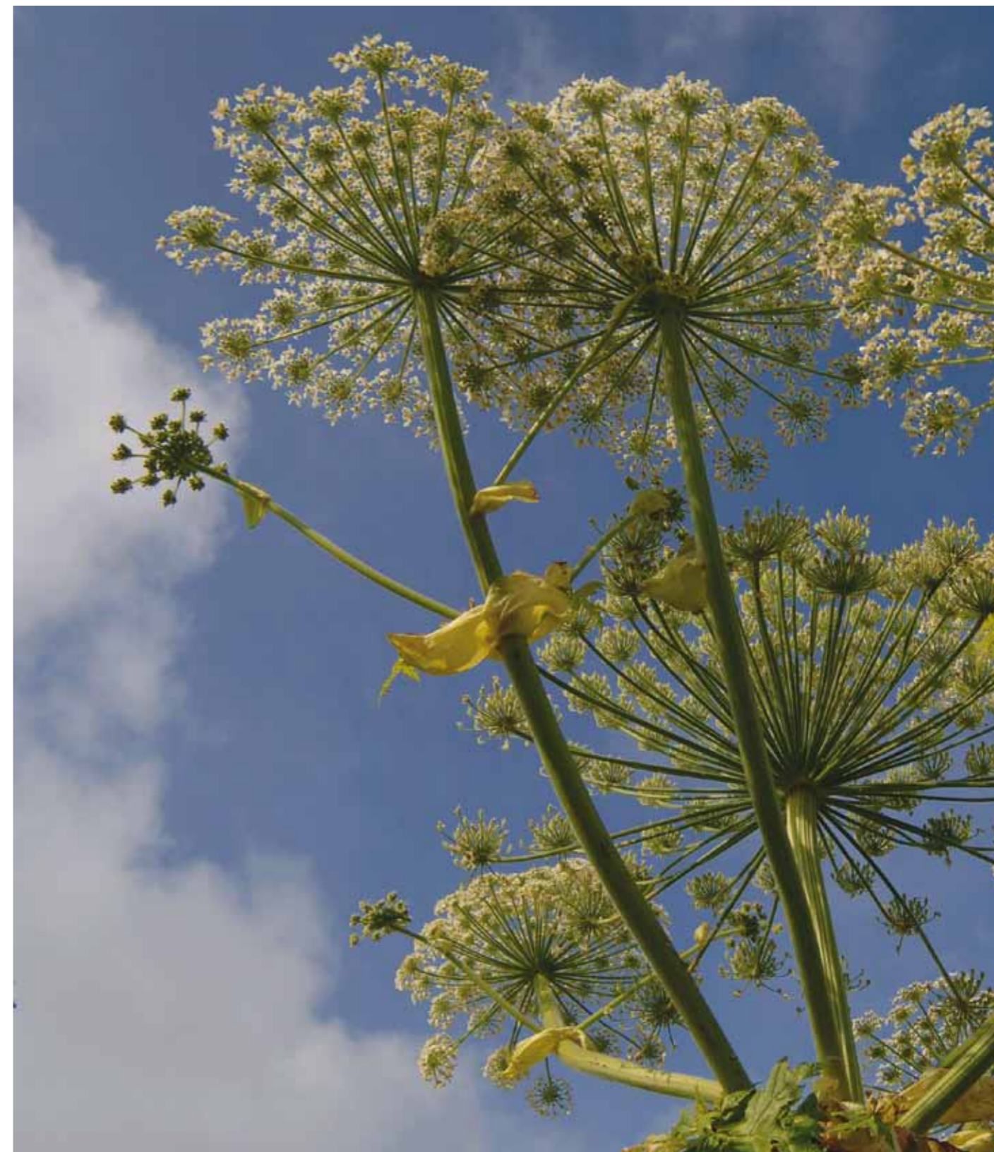
Smuk ser den ud bjørnekloen, men planten skygger al anden vegetation væk, og derfor skal den væk.

- Jeg er vild med Vaserne og Furesøen i det hele taget. Der er uberørte partier med ellesump, og der er en magi af jomfruelighed i store dele af området. Herude har man en fornemmelse af, at man godt kan finde steder,