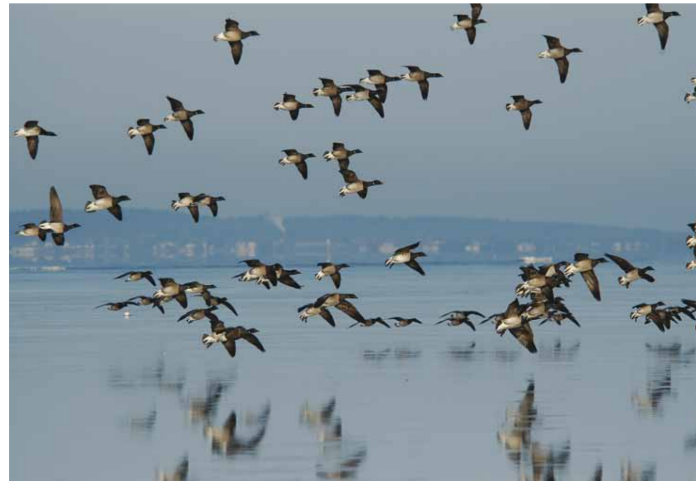
Knorr – knorr – en flok lysbugede knortegæs gør klar til landing.