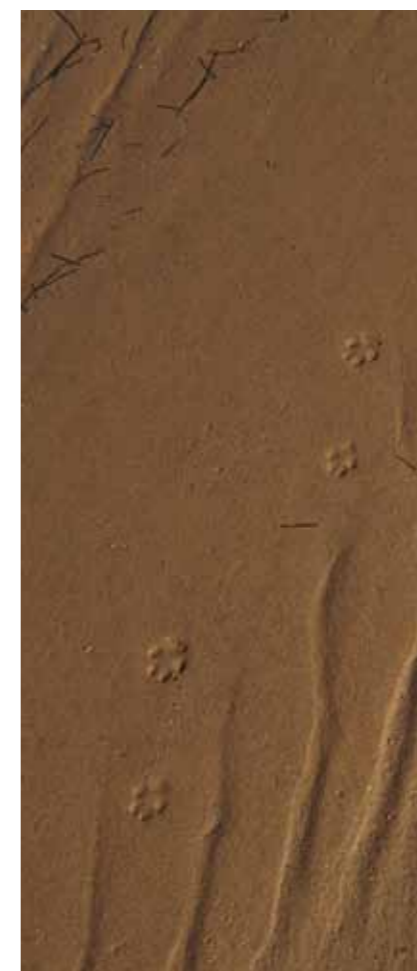
Rævespor i sandet.

Der er lavet adskillige kunstgrave til ræve på Nyord. Rovdyrene flytter ind i disse menneskeskabte grave, hvor de så er lettere at jage, fordi man kan sende en gravhund ned og på kommando genne rævene op til jægerne.