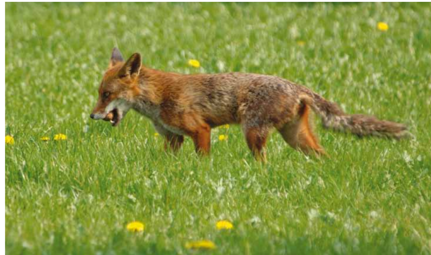
En ægrøver taget på fersk gerning - her vistnok med et hønseæg.

Vi har at gøre med et såkaldt intelligent design. Det vil i dette tilfælde sige, at spærringen - rævebommen om man vil - åbner af sig selv, når der kommer biler, som skal over broen. Åbningen sker ved hjælp af følere i kørebanen.