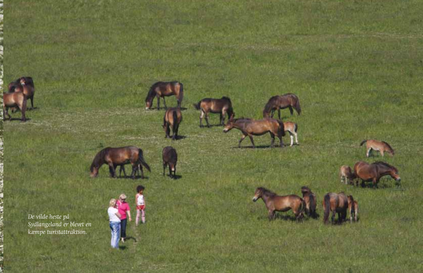
De vilde heste på Sydlangeland er blevet en kæmpe turistattraktion.

På Sydlangeland græsser vildheste til gavn for gæs og gøgeurter i Fugleværnsfondens reservat Gulstav Mose. Græssende dyr er af vital betydning for mangfoldigheden i mange naturområder