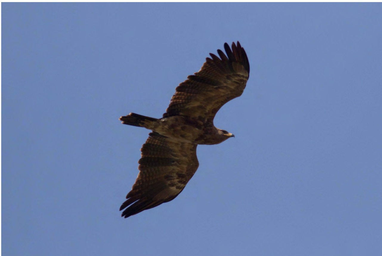
Lille Skrigeørn 3K, Hyllekrog 14. maj 2016

Vintervejr var der ikke meget af i år, da frost, sne og is var indskrænket til perioden ca. 29/12 og kun frem til 23/1. Herefter et par dage med tåge efterfulgt af nærmest forårsvejr allerede fra den 25/1 (op til +5 gr.). Selvom den efterfølgende periode frem til 10/2 var meget mild, var den mest præget af regn og kraftig blæst, hvorfor der først blev startet op med trækobservationerne på denne dato. Der har således i denne tidlige periode nok alligevel i alt passeret et par tusinde fugle af de tidlige arter, især andefugle (f.eks. Ederfugl og Sortand).