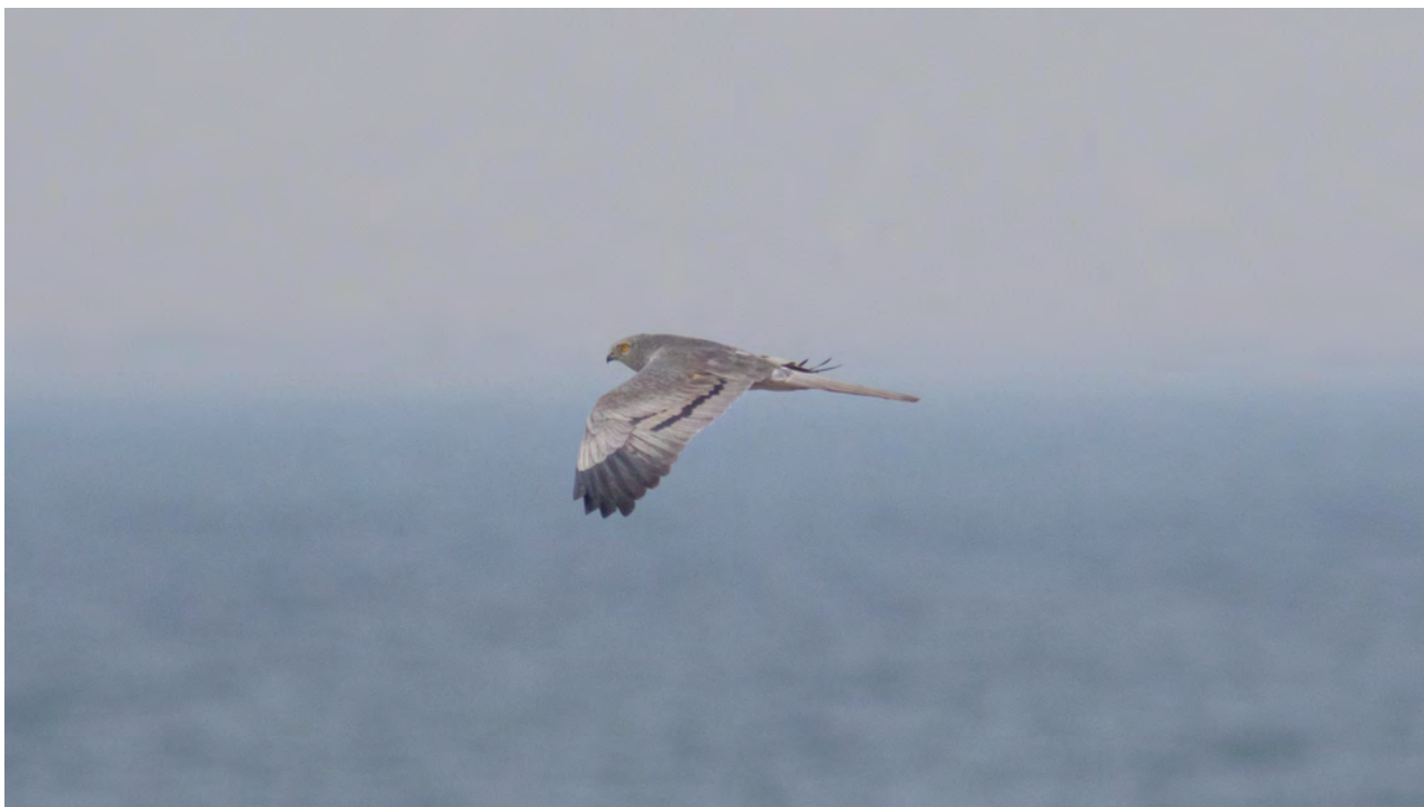
Hedehøg han, Saksfjed Inddæmning 3. maj 2016

Det blev til hidtil ringeste år for Havlit (742) med hele 55,2% under gennemsnittet! Største dag faldt igen i år tidligt med 1/3 178 trk. Derimod er Sortand (84.632) stadig rigtig godt kørende med 20 dage med over 1000 trk. (11/2 – 15/4) og her flest 25/2 5065, 21/3 9860 og 22/3 7000. Det gik også fint for Fløjlsand (598), som havde næstbedste forår, men her er de største trækdage temmelig beskedne (max. 14/2 34) p.g.a. et meget udstruktet træk igennem hele foråret. De næste 4. arter havde ligeledes deres næstbedste forår for lokaliteten, således både for Hvinand (492), Lille Skallesluger (38), Toppet Skallesluger (12.146) og Stor Skallesluger (271). Toppet Skallesluger havde desuden et meget bemærkelsesværdigt tidligt træk i år, hvor de største dage allerede lå med 14/2 1121, 26/2 530, 29/2 1265 og 1/3 732. Dog sås stadig en klar top i april måned: 10-15/4 i alt 1772 fugle og her flest 12/4 495. Antal trækkede fugle efter endt obstid blev ud fra opgjorte halvtimetotaler og lignende dage skønnet til ca. 1450. Som et forsøg blev direkte trækkede toppede skalleslugere i lighed med Ederfugl også kønsbestemt dette forår. I alt 7334 fugle ud af totalt 12.146 trækkende (60,4 %) blev bestemt og hunprocenten endte på 35,4 %.