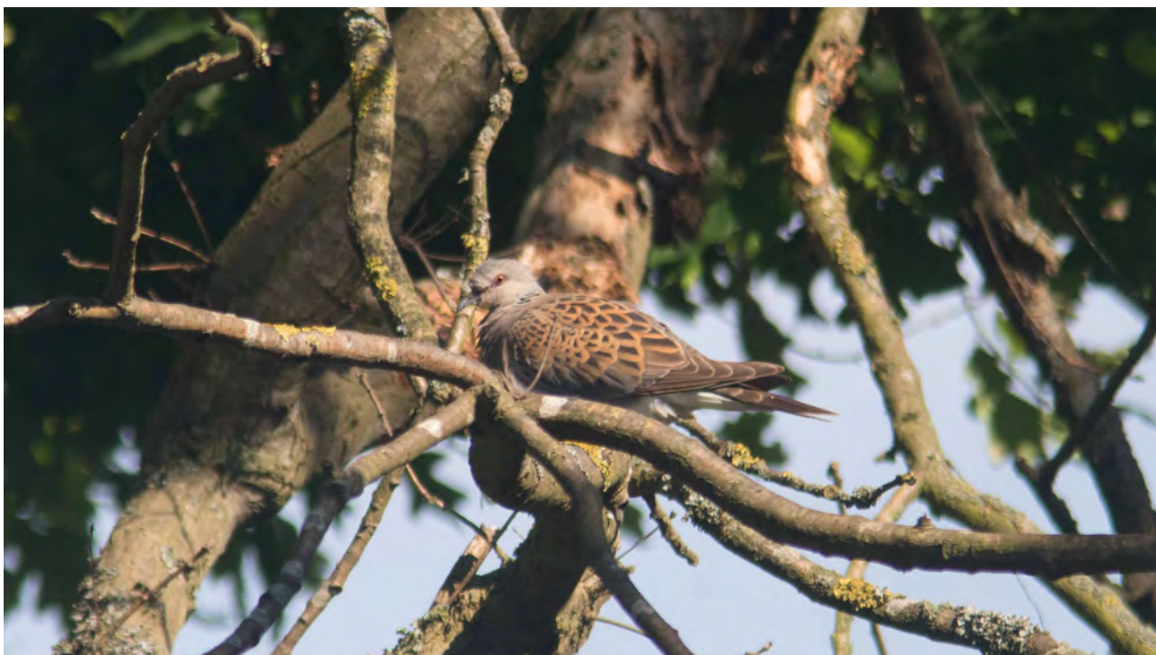
Turteldue, Saksfjed Inddæmning 2. juni 2016

Det mest interessante for alkefuglene i denne omgang var nok at Alk overhalede Lomvie for første gang siden tællingerne startede i 2008: Lomvie (35), Alk (41), Alk/Lomvie (19) og Tejst (3).