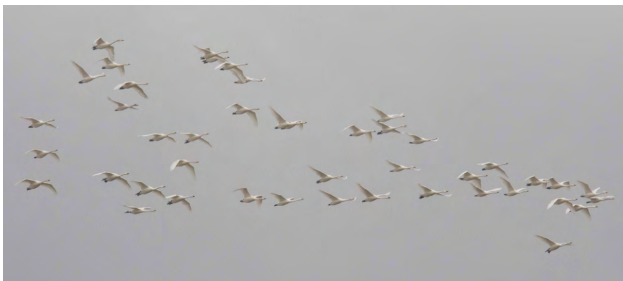
Pibesvaner, Hyllekrog 23. marts 2016

Antallet af Toppet lappedykker lå i år også meget lavt med kun 127 trk., mens det gik lidt bedre for Gråstrubet lappedykker (467), men dog kun i kraft af disse 2 gode dage: 9/4 110 og 14/4 226 (næsthøjeste tal fra lok). Med andre ord næsten trefjerdedele af sæsontotalen på 2 dage. Nordisk Lappedykker sås med i alt 10 trk.+ 1 rst. i tiden 26/2 – 13/4, hvilket netop er hidtil højeste træktotal, men samlet set ikke bedste år når både træk og rast sammentælles. Flest fugle sås 9/4 med 4 trk. Igen i år sås mange suler for stedet: 26/2 – 3/6 i alt 9 fugle. Det blev hidtil bedste år for Pibesvane med 339 trk. i tiden 8-24/3 med flest 17/3 80 og 21/3 78. Dens gulnæbbede fætter kom op på de sædvanlige beskedne antal (196) og her flest 7/3 89.