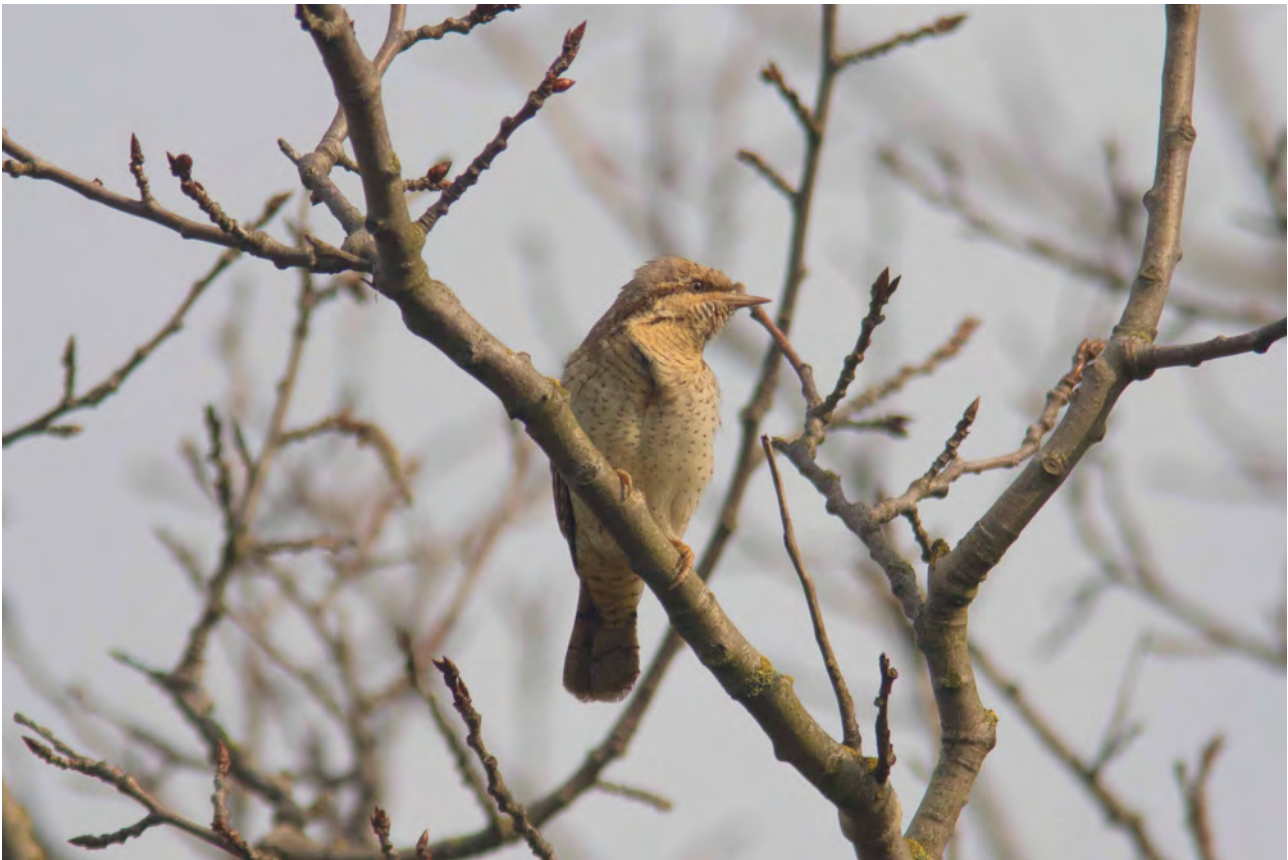
Vendehals, Saksfjed Inddæmning 3. maj 2016

på direkte træk. Et rasttal af Huldue kan dog nævnes 6/3 116 rst., som sikkert er vinterflokkene fra Bjernæs Husby (her op til 170) på udflugt.