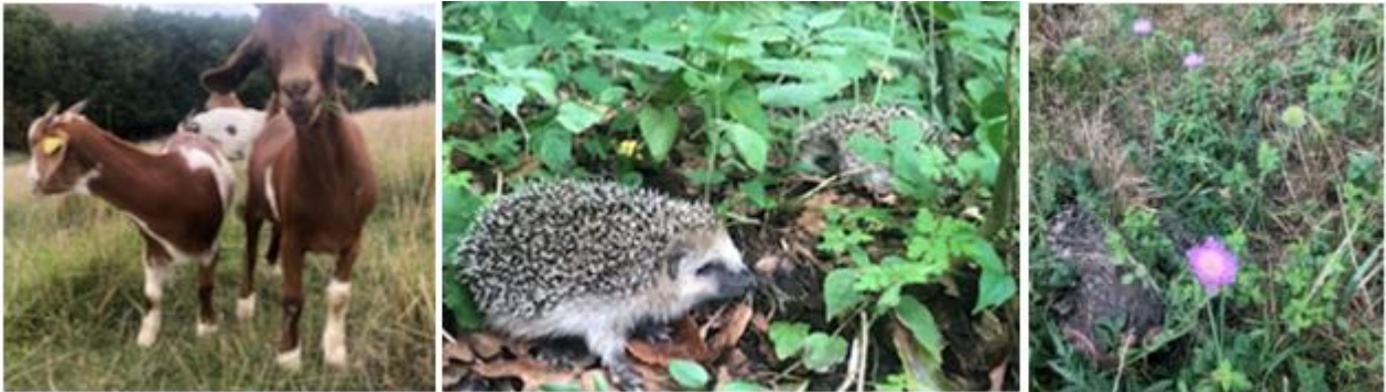
Billeder fra dagen: geder, pindsvineunger og Blåhat

Mødet blev afholdt i det nye redskabsrum. Efterfølgende stod den på et par timer i dalen, hvor ørnebregnen fik sig en tur, og der blev set nærmere på de kommende arbejdsopgaver.