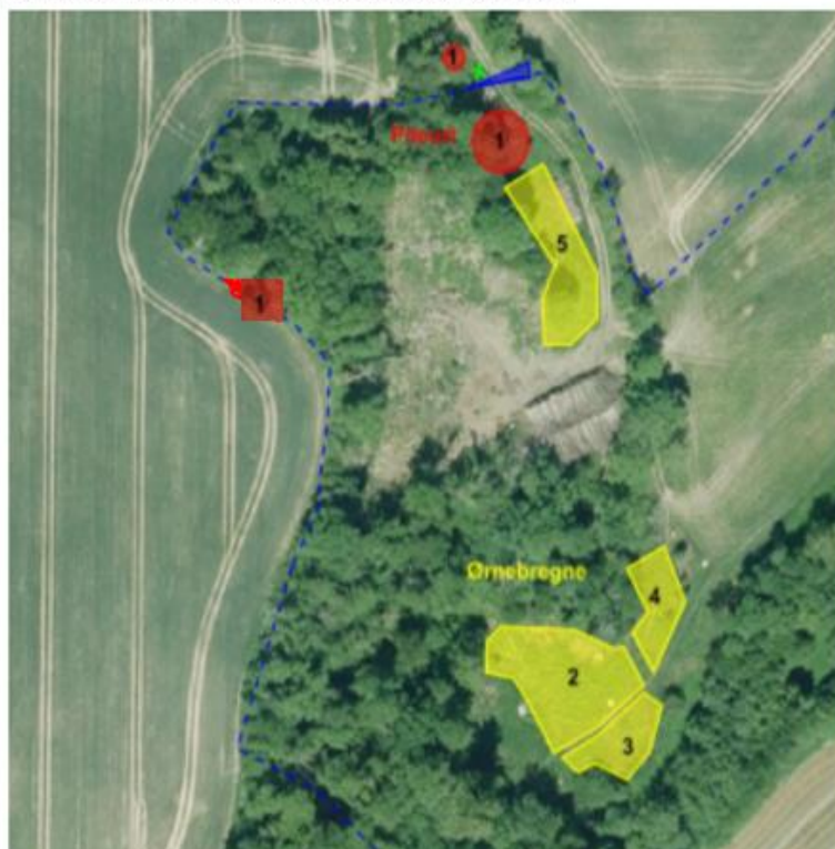
Kendte bevoksninger med pileurt og ørnebregne

Ørnebregnerne står nu langt mere spredt, og det er tydeligt, at indsatsen har sin effekt. Græsser og urter som mjøddurt, sankthansurt m.fl. har koloniseret arealerne, og der er registreret 20 eksemplarer af blåhat på arealerne, hvoraf flere stadigvæk står i blomst.